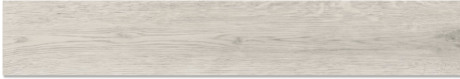
Ottawa-R Gris G.172