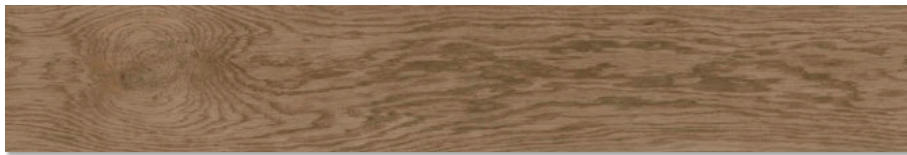
Ottawa-R Miel G.172