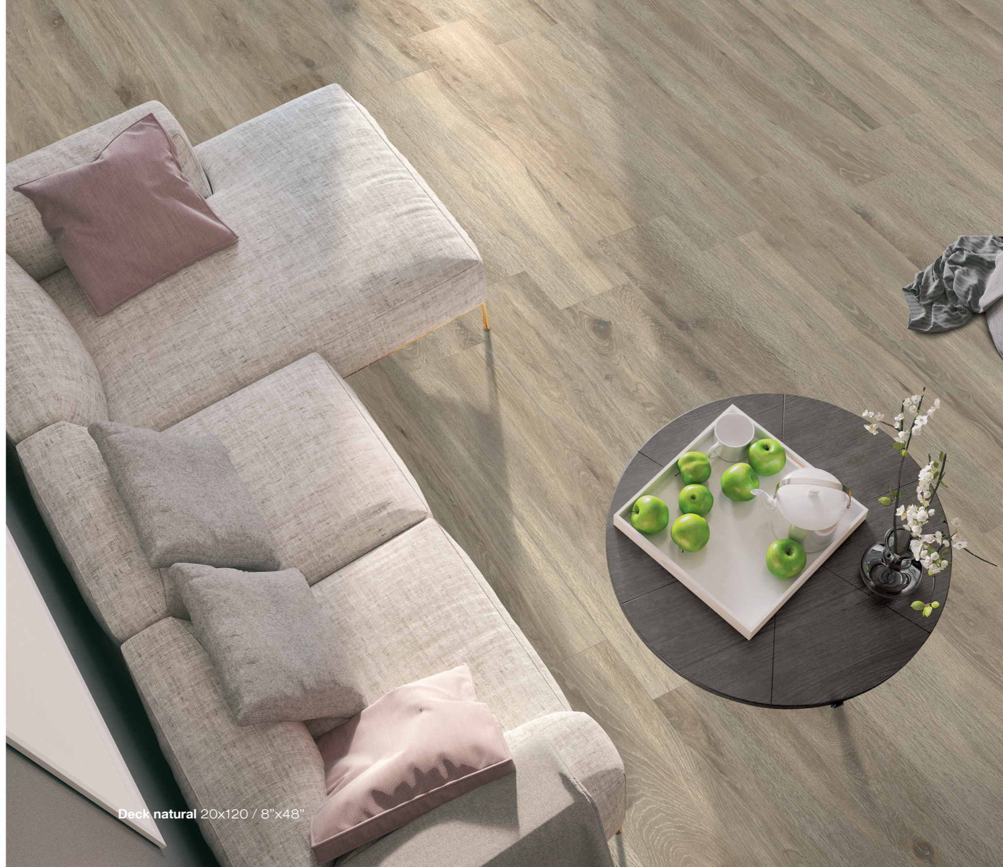
Deck natural 20x120 / 8"x48"