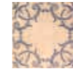
DECOR BARRO 1 20x20 (M 220) 8"x8"