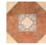
OLHAMBRIILLAS BARRO 20x20 (M 220) 8"x8" (3 piezas diferentes por caja) - (3 different pieces per box)