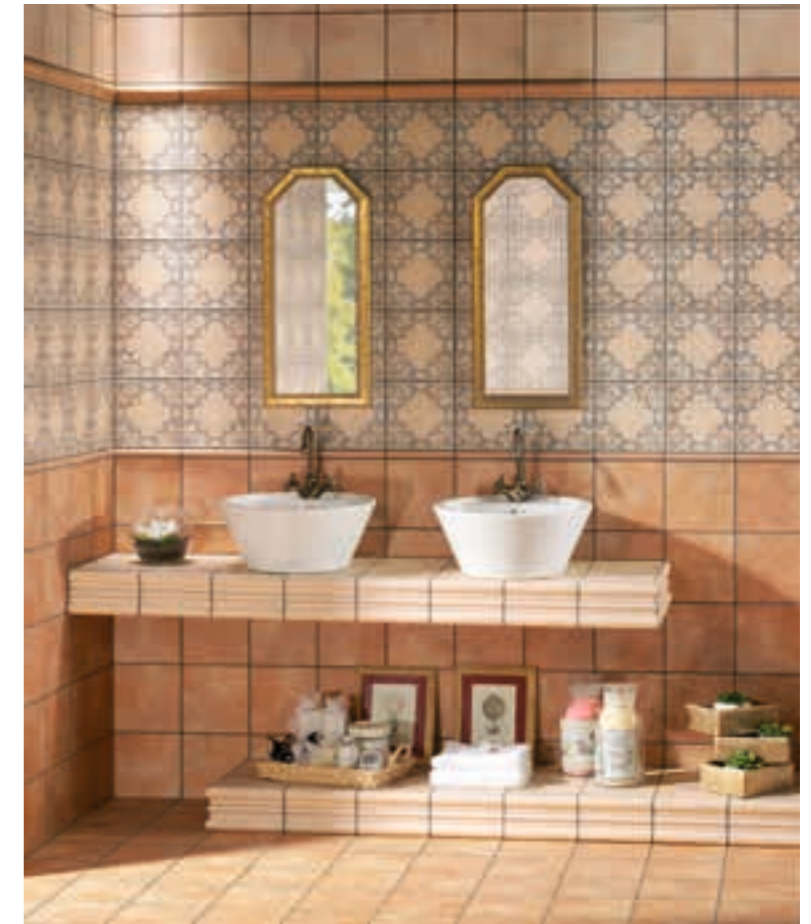
Barro Ocre 20x20 · 8"x8" · Barro Crema 20x20 · 8"x8" · Decor Barro 1 20x20 · 8"x8" Moldura Barro Crema 5x20 · 2"x8" · Torelo Barro Crema 2x20 · 1"x8" · Torelo Barro Ocre 2x20 · 1"x8"