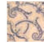
DECOR BARRO 3 20x20 (M 220) 8"x8"