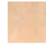
BARRO CREMA 20x20 (M 220) 8"x8"