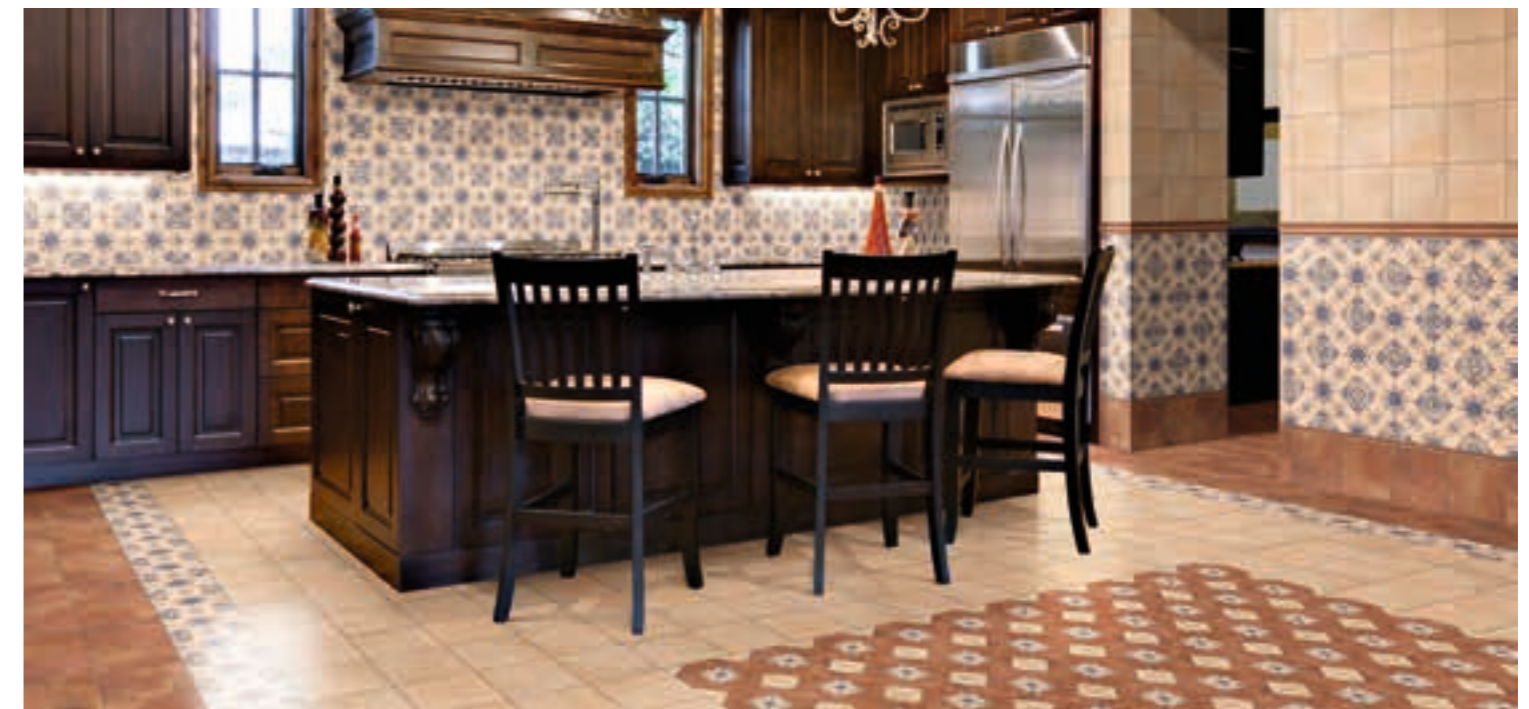
Barro Cotto 20x20 · 8"x8" · Barro Crema 20x20 · 8"x8" · Decor Barro 2 20x20 · 8"x8" Olhambrellas Barro 20x20 · 8"x8" · Moldura Barro Cotto 5x20 · 2"x8" · Torelo Barro Cotto 2x20 · 1"x8"