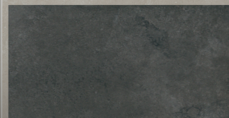
antibes dark grey